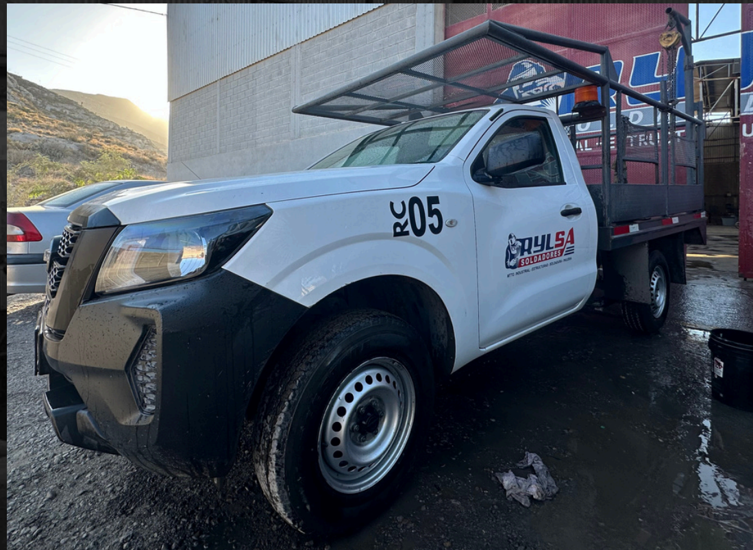
CAMIONETA ESTAQUITAS (4)