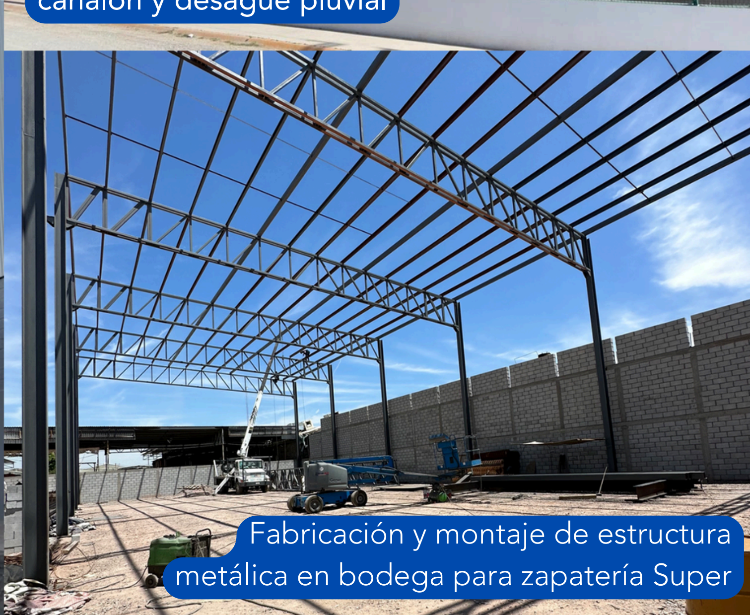
Fabricación y montaje de estructura metálica en bodega para zapatería Super