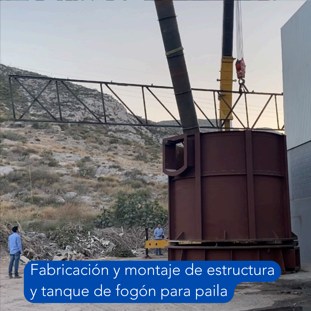
Fabricación y montaje de estructura y tanque de fogón para paila