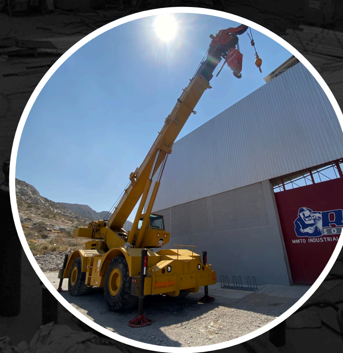
GRÚA TODO TERRENO