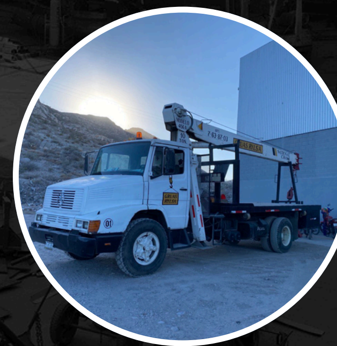
GRÚA TIPO TITÁN