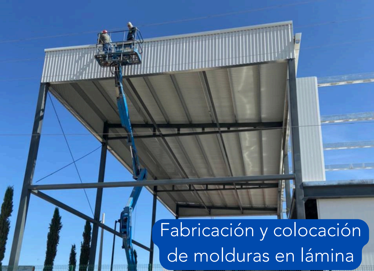
Fabricación y colocación de molduras en lámina