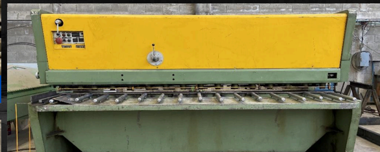
Cortadora (cizalla) cap. hasta 1/2"