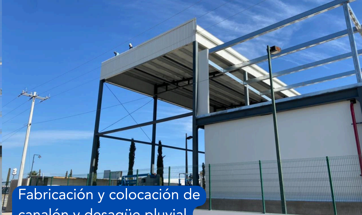
Fabricación y colocación de canalón y desagüe pluvial