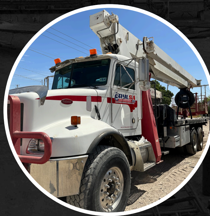
GRÚA TIPO TITÁN