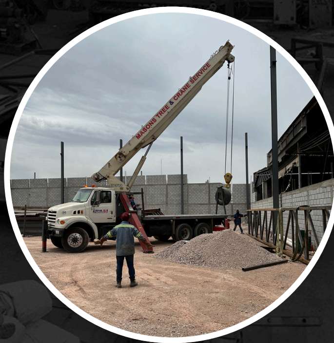
GRÚA TIPO TITÁN