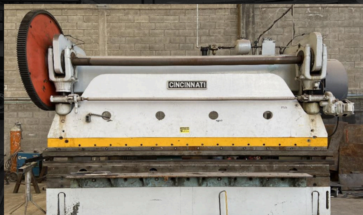
Dobladora cap. hasta 3/8"