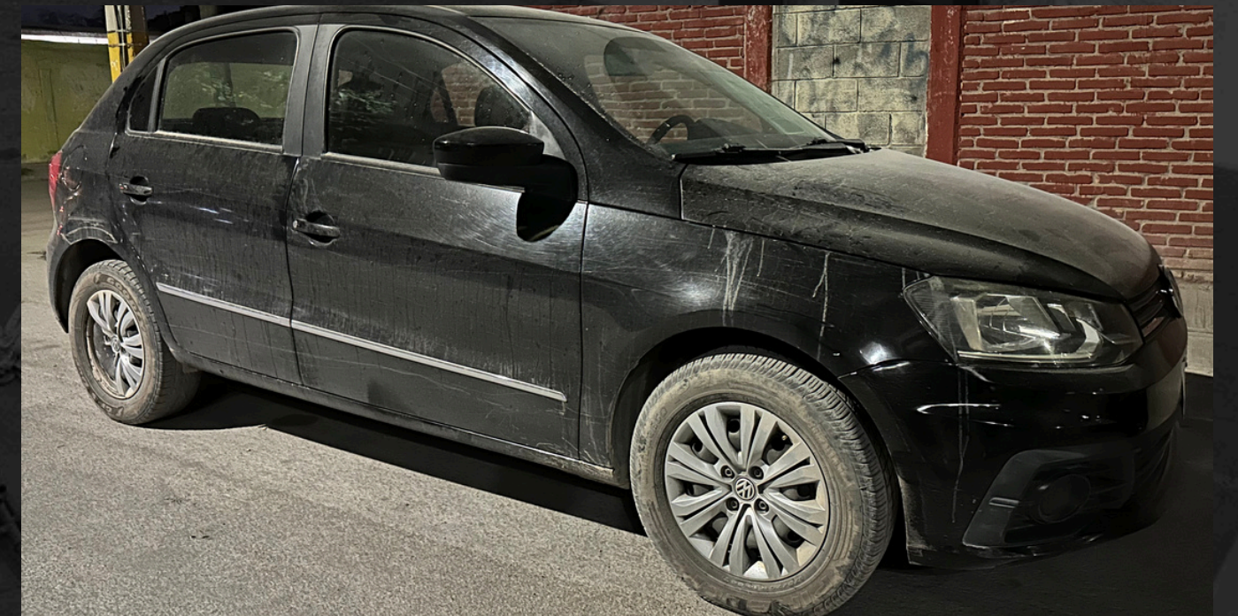
CAMIONETA TRANSPORTE PERSONAL (1)