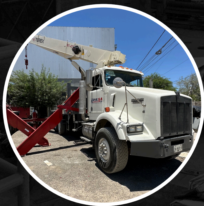
GRÚA TIPO TITÁN